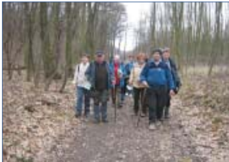
A veszprémi Építők TSE tagjai február 2-án az ÉDTTSZ nyitó teljesítménytúráján