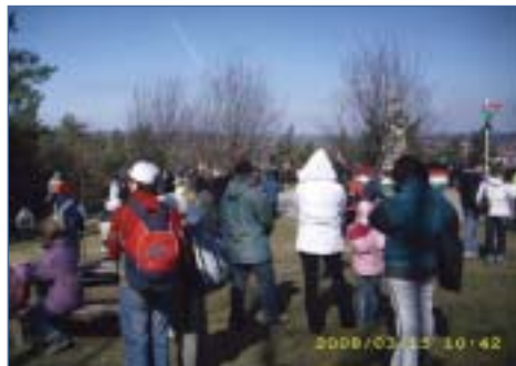
A BTSSz Ifjúsági Bizottságának isaszegi emléktúráján