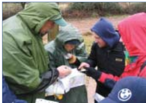
Túravezető gyakorlótúrán – Gördögök Kerékpáros és Szabadidő Sportegyesület