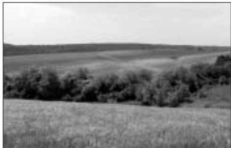
Alacsony dombok Kiszékely mellett

Hőgyész után ismét kezdtem aggódni, mert idáig tartott a térkép, de aggodalmam ismét alaptalannak bizonyult. Egy hosszú sáros gerincre vitt az út és a vége felé egy fiatal akácosba értem, ahol érdekes módon nem volt jel, de az ösztönöm azt súgta, hogy mégis jó úton járok. Így is lett, és egy tágas mezőn találtam magam, ahonnan egy, a térkép hátulján levő 1:300 000 vázlat alapján gond nélkül eljutot-