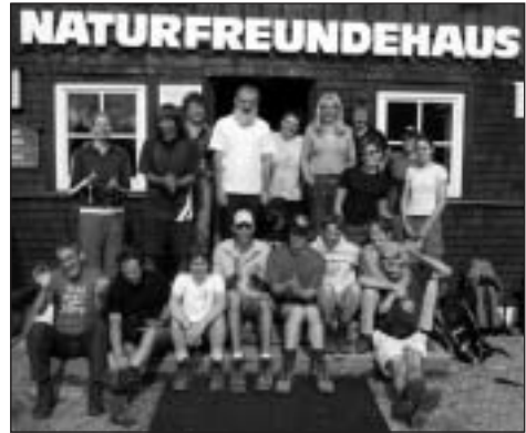
Német fiatalok egy természetbarát ház előtt

A résztvevők egyetértettek abban, hogy egy organikus, a feladatoknak megfelelően dinamikusan változó, projektlapon működő NFI-re van szükség a jövőben. Kiálltak amellett, hogy a természetbarát egyesületek veze-