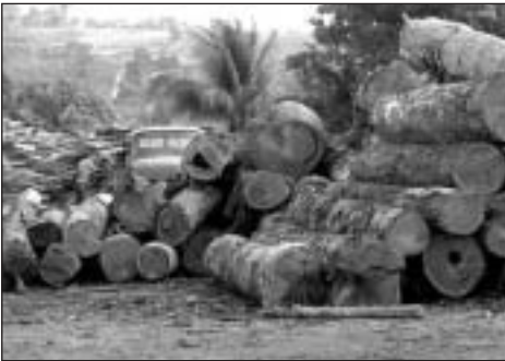
Kivágott fák az Amazonasnál

A Föld Barátai (Friends of the Earth) elnevezésű környezetvédelmi szervezet felszólítja az Európai Uniót, hogy fogadjon el olyan jogszabályokat, amelyekkel elejét lehet venni az illegálisan kitermelt fa értékesítésének Európában. A szervezet közölte, hogy négy európai uniós építkezési projektnél fedezték fel illegális faanyag felhasználását. Tudomásuk szerint az Európai Unió által finanszírozott projektekben használtak fel illegálisan kiter-