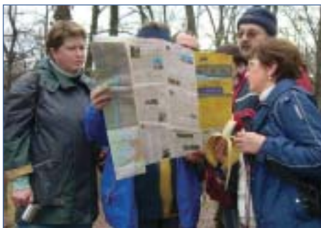
Térképmustra a Völgység Turista Egyesület (Bonyhád) januári túráján