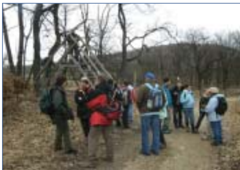
Keritélmászás a MOL-DUFI februári túráján