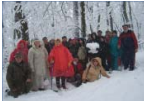
A veszprémi Építők TSE túrázói a Bakonyban