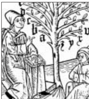
A tudás fája (középkori fametszet)

összeült, és megállapította, hogy a következő lépés egy fokkal el kell hogy térjen az eredeti elképzelésektől. Ahhoz ugyanis, hogy az MTSz egy alapvető gondolkodásbeli váltást tudjon megvalósítani, hogy hatékonyabban, korszerűbben tudjon működni, tovább kell képezniük magukat a szervezet különböző szintű vezetőinek. Többségük nem rendelkezik a mai világ kihívásaira válaszoló, elengedhetetlenül szükséges, korszerű ismeretekkel. Értendők ez alatt például a projekttervezési és -vezetési, pályázatírási ismeretek, különböző kommunikációs technikák készségszintű ismerete, konfliktuskezelés készsége, gazdálkodási ismeretek. A fejlesztés, korszerűsödés menetébe tehát új elemként be kell kerülnie egy átfogó képzési programnak.