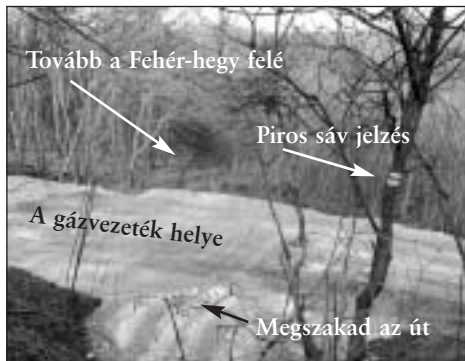
Ezen a helyen vágja ketté a piros sáv turistajelzést az épülő gázvezeték nyomvonala. A szintkülönbség 3 méter