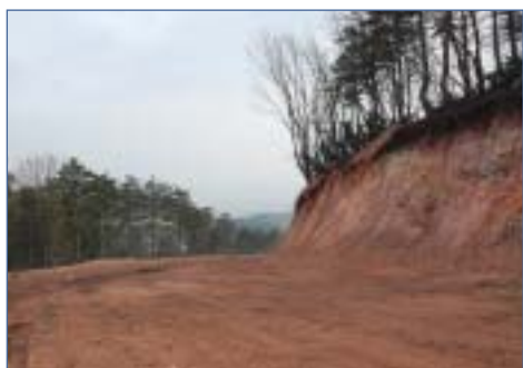
A Vörös-hegy csonka lábánál