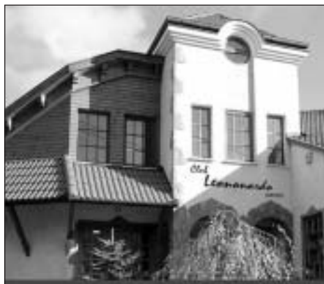
Club Leonardo étterem és panzió

Megállapodás született az Országos Kéktúra útvonalán lévő mogyorósbányai Club Leonardo étterem és panzió tulajdonosával, miszerint a Magyar Természetbarát Szövetség érvényes igazolványával rendelkező személyek 10% kedvezményt kapnak a mindenkori szállásdíjból.