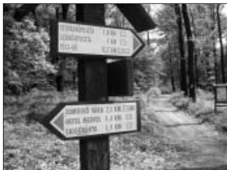
Útjelző táblák a Karancs-Medves vidékén

Nevezési cím: Nógrád Megyei Természetbarát Szövetség, 3100 Salgótarján, Bartók Béla út 10.