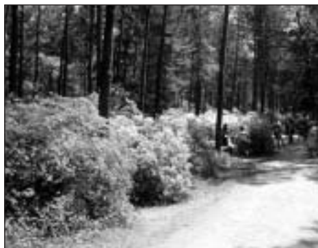
A jeli arborétumban

Örömmel számolhatunk be arról, hogy a „Tárt Kapus Létesítmények” pályázaton elnyert jelentős összegből már nemcsak a környékre, hanem távolabbra is eljutottunk! Eddig 13 alkalommal buszos kirándulásokra is sor került, ami programjaink népszerűségét