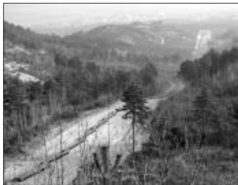
Kilátás a Vörös-hegyről. A távolban Pilisvörösvár házaí sejlnek fel a párából