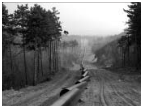
Összehegesztésre váró gázcsövek a Zajná-hegyekben, a sárga sáv turistajelzés vonalában

Errefelé túrázni mostanság egy kissé a katasztrófaturizmus műfajára hajaz... F. A.