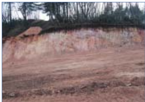
Ahol a hegy szakad