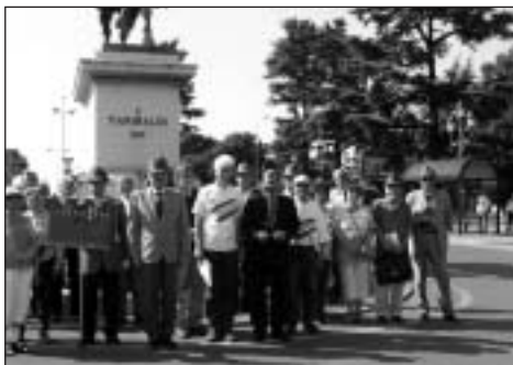
Koszorúzás után Bresciában

Az Olajipari Természetbarát SE 50 fős csapata szeptemberben a Tonale-hágó környékén túrázott. Itt húzódott az I. világháborús osztrák front első és második vonalának egyik szakasza. Ennek építményei, illetve azok maradványai ma is fellelhetők, esetenként nehezen megközelíthető helyeken, hiszen a magashegyi, részben gleccsereken zajlott harcok színtereiről van szó.