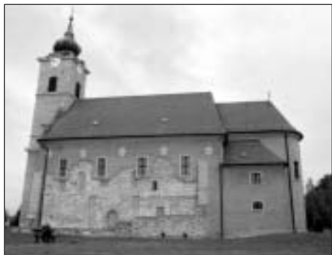
A feldebrői erődtemplom

egy darabig, aztán jókora sziklák, mire végre felértünk. Jócskán lihegve báméskodtunk percekig a szépséges tájban, Parád, Recsk és az előző heti utunk kitűnően látszott. Az egyik jelzés néhány méterre volt tőlünk, ezt be is rajzoltuk, majd az útmutatás szerint elindultunk 3-szor a másikhoz, de sehogy sem találtuk. Férjem arcát elnézve átvillant az agyamon, „csak nem akarja feladni?”, részemről szó sem lehetett, úgyhogy valami mentőötlet kellett. Ez pedig az volt, hogy azt feltételeztük, hogy a leírás össze lett keverve a táblákhoz képest. Hát így hamarosan megtaláltuk, és mint utóbb kiderült nyomdahiba volt, csak mi akkor nem tudtuk.