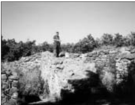
Mátrafüred, Bene vár

Gyöngyöstarján, Világosvár felkeresése sem volt piskóta, ahogy szoktuk mondani. Szinte már a faluból látszik, hogy hova kell menni: a legmagasabbra (815 m) a környéken.