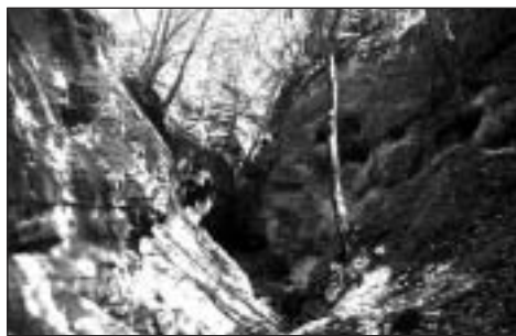
A Páris-patak szurdokvölgye

A Palóc Grand-kanyont egy hétköznap, barátommal látogattuk meg. Hosszú vonatozást és kétszeri átszállást követően érkezünk meg az Ipoly menti Nógrádszakálra. A Cserhát turistatérképe mellett az „Északi zöld” regionális túraútvonal térképes útikalauzát is magunkkal vittük.