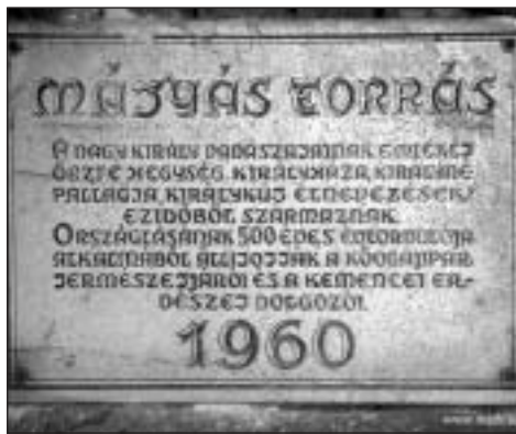
A Mátyás-forrás táblája Királyházán

December 30-án – miután „cuccaink” nagy részét gépkocsi felvitte Királyházára – Diósjenőről a Závóz nyergen át túráztunk Királyházára. A városi szürkeség után csodálatosan szép volt a zúzmarás erdő, a nagyrészt a jég alatt folyó Kemence patak. Az új turistaházban szállásfoglalás és gyors ebéd után a csapat egy sötétedésig tartó körtúrát csinált. Egy ötfős csapat elkészítette a mindenki által hozott alapanyagokból a hagyományos paprikás krumplit. A bőséges mennyiségből repetára, sőt másnap reggelire is jutott többeknek.