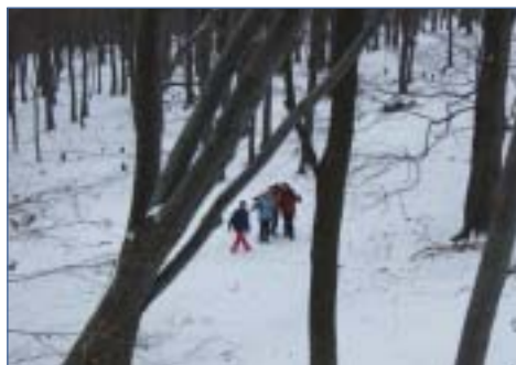
A Hidas-bérc alatt II.