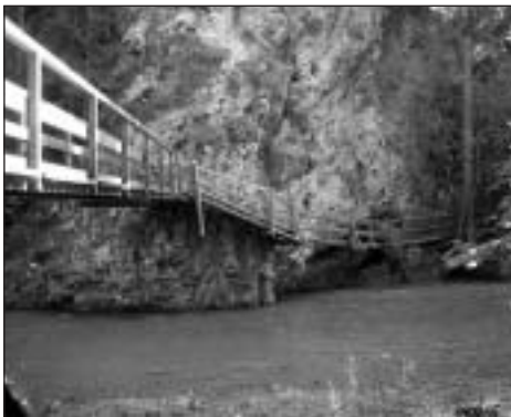
A Rába-szurdokban