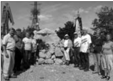
A doberdói emlékhely megkoszorúzása

kapcsolatos hazai megemlékezést és ismeretterjesztést is segíthetik. A helyi alpinista kluboknak azt a szívességét, hogy térképekkel, dokumentumokkal, túravezetéssel segítették