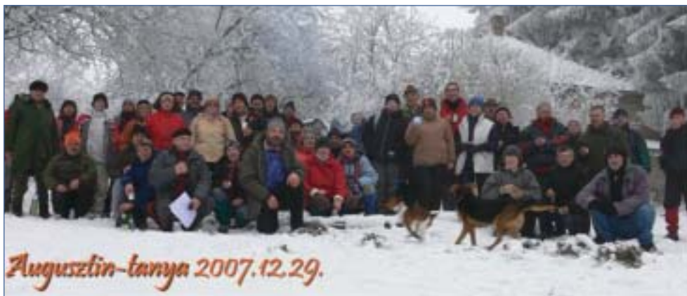
A Veszprémi Építők TSE által szervezett december 29-i túrán a résztvevők megpihennek az Augusztin-tanyánál

(Címlapunkon: Papp János a Japán Alpokban.)