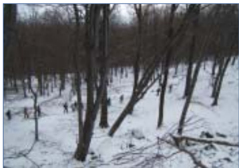
A Hidas-bérc alatt I.