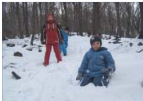
Lefelé több lett a hó...

Merva László fotói a Kékes Turista Egyesület nyílt túrjárójáról (2008. január 5. Mátrafüred–Csatorna-völgy–Kékes–Négyeshatár–Mátrafüred)