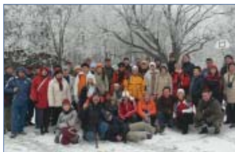
Pillanatképek a Vértesi Erőmű SE és a Tatabányai Energetika SE természetjáróinak 2007. december 29-i évzáró túrájáról