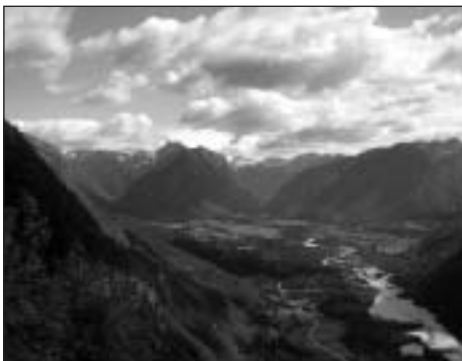
Az Isonzó-völgy