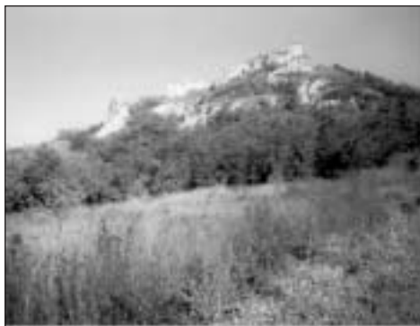
A siroki vár

Azért kezdtük el, mert sokszor és szívesen járunk a Mátrát eddig is, úgy gondoltuk, ismerjük is, de amint elkezdtük e túrákat, rájöttünk, hogy még mindig rengeteg új dolgot tartogat számunkra.