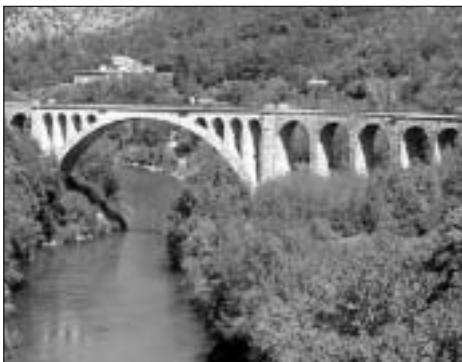
A Sójahok völgye Isonzóban