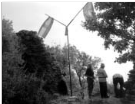
A markazi várromnál

Ugye, szinte minden turista volt már a siroki várban, sőt a felújítások eredményeképpen, aki sosem túrázott, az is könnyedén fel tud jutni, de ki tudja, hogy e várral szemben áll a Kis-várhegy, ahol a bronzkorban vár állott, melyet a középkorban tovább erősítettek? És vajon, aki ezt tudja, járt is ott? A sportpályától meredek vízmosáson másztunk felfelé a sáncokig, mind a bronzkori,