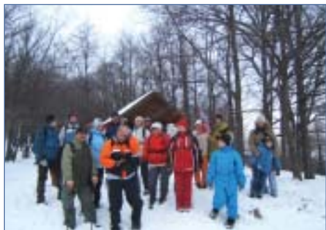
Négyeshatár, nehéz a túravezető élete