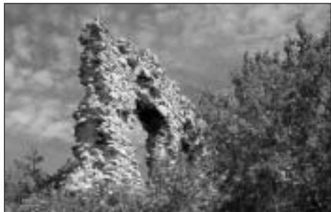
A csővári romok

Nézsáról busszal lehet visszatérni Vácra. Ezúttal nem arra mentünk. Az említett elágazás jobbra vezető ágán, rövid kaptatóval elérhető az emlékfá. Sajnos, pihenőnek nemigen nevezhető már, mert a pad hiányzik.