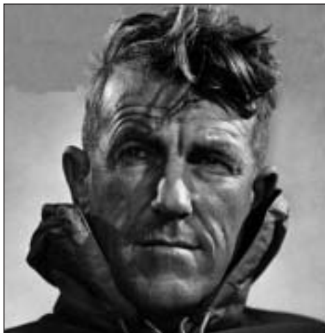
Edmund Hillary, aki elsőként jutott fel a világ tetejére